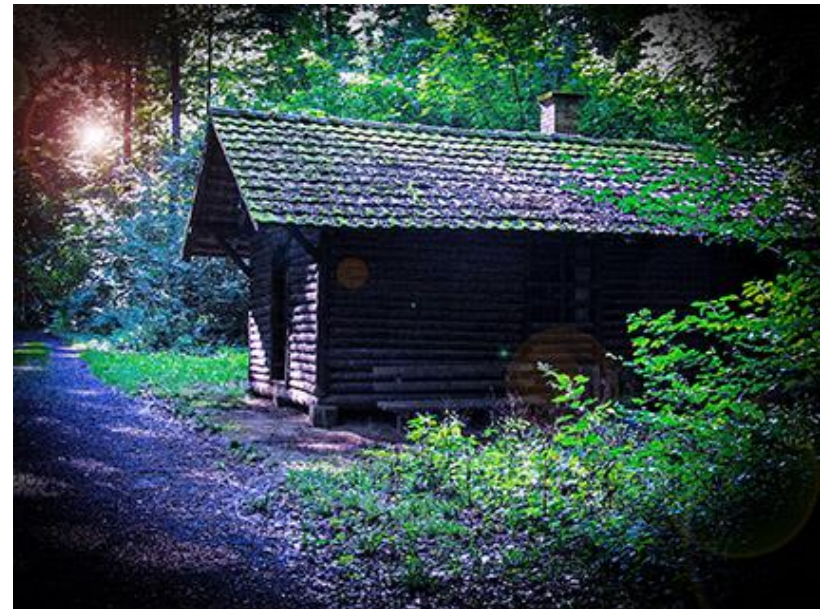
Michael Linnenbach - Eigenes Werk, CC BY-SA 4.0

Vom 9. bis 11. Juli 2021 in Hilders in Rhön