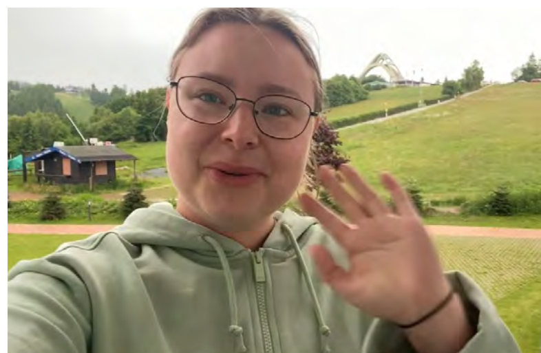
Wanderjugend News #106 - Pfingstsonntag